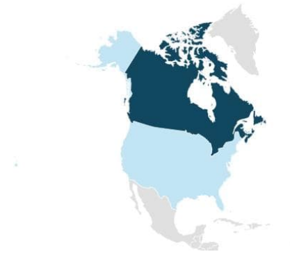
Tableau représentatif de la distribution de l'emplacement de l'ensemble de nos fournisseurs lorsque Sartigan Inc. est l'importateur officiel.